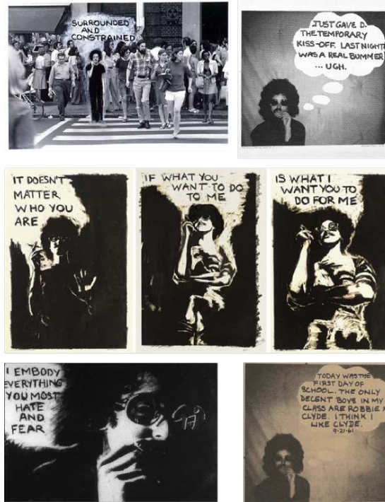
The Mythic Being, 1973-1975 Adrian Piper

etnográficas. A questão do corpo no processo artístico é de materialidade e radicalidade,