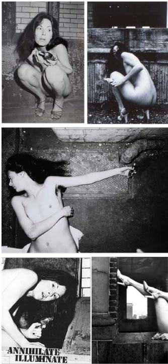
So Help Me Hannah 1978 Hannah Wilke

mítico, representado pela figura performática encenada pela artista desnuda questões de preconceito e também de androgenia.