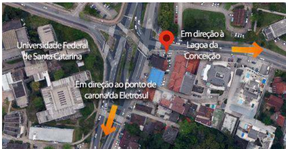
Fig. 3 – Mapa do ponto de carona do Córrego Grande (marcado pelo símbolo vermelho).

Fonte: Google Maps (acesso em julho/2014). Alterações feitas pelos autores.