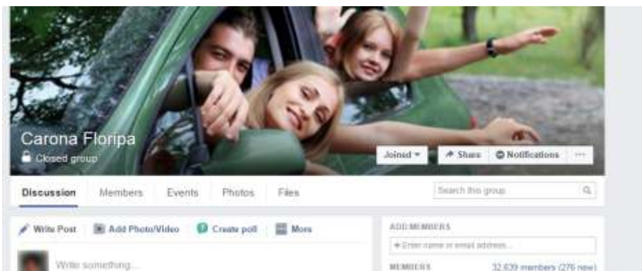
Fig. 1 - Imagem de capa do grupo Carona Floripa no Facebook.