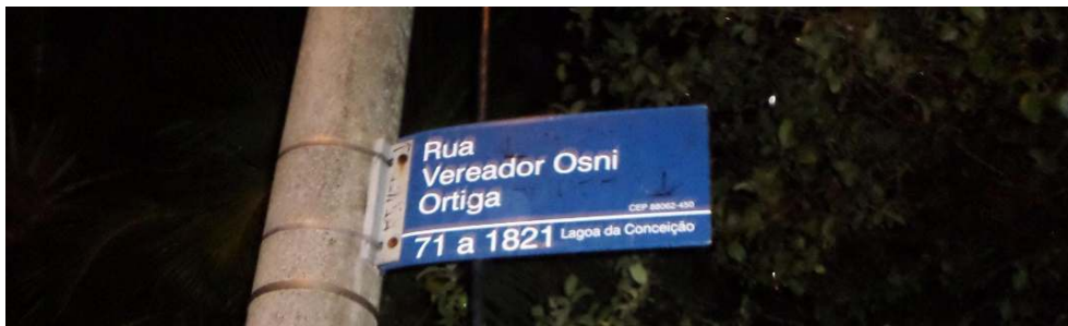
Fig. 8 – Placa marca o início da Av. Osni Ortiga, onde pegamos nossa carona da Lagoa para o Campeche.